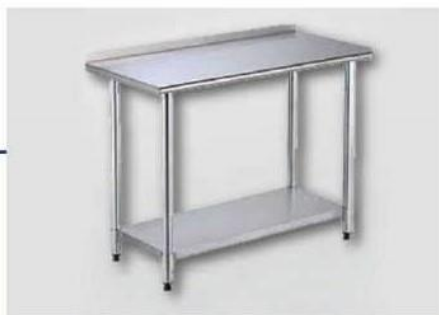
انواع میز و کمد استیل