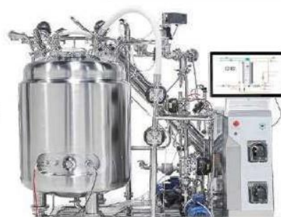
Cip - Sip