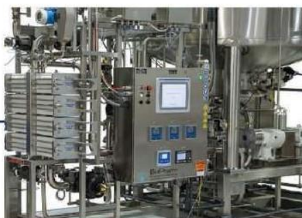
انواع سیستم فیلتراسیون TFF - Depth