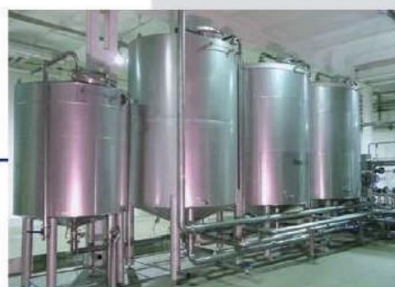
انواع مخازن فرابندی و ذخیره سازی