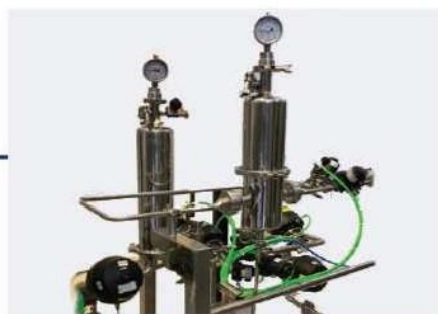
انواع فیلتر هوزینگ