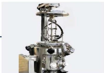
ساخت انواع مخازن آرایشی بهداشتی