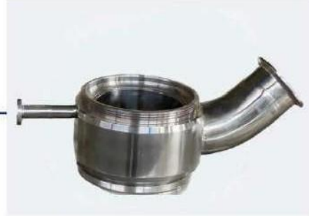
Flash Bottom Valve